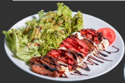
Салат з телятини