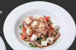
Салат з язиком та фетою