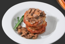
Деруни з грибним соусом