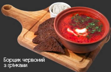
Борщик червоний з грінками

навариста та пикантна перша страва, приготована з м'яса, солодкого перцю, меленої паприки, помідорів, картоплі, моркви та спецій