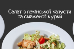
Салат з пекинської капусти та смаженої курки