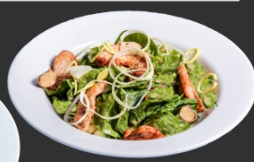
Салат з Індичкою та шпинатом

ТЕПЛИЙ САЛАТ З ТЕЛЯТИНИ ТА МОЦАРЕЛИ 420,25 185 89,99