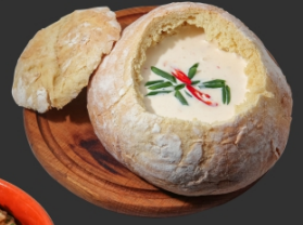
Ірландський сирний суп