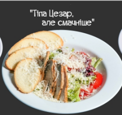
"Тіпа Цезар, але смачніше"